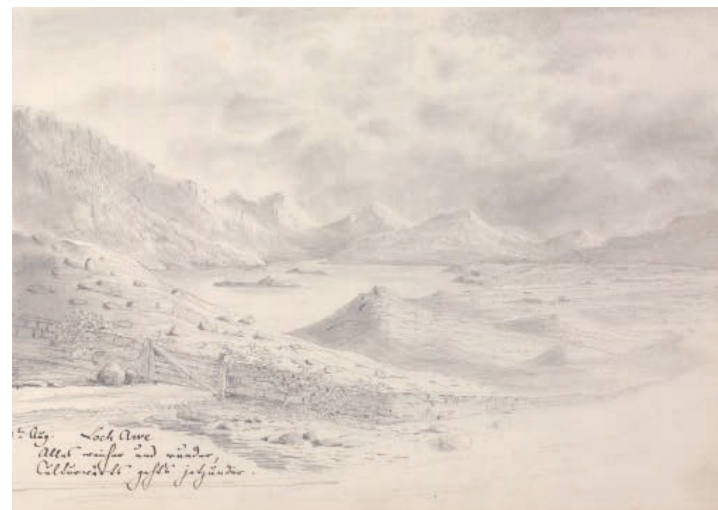
Loch Awe (links: Felix Mendelssohn/rechts: Kasper Schoneville)

gespuugd. Allerlei openbare instellingen, zoals veel scholen en bibliotheken, waren voor Joden verboden terrein. Daarom besloten Mendelssohns ouders op den duur om hun kinderen te laten dopen in de Evangelische Kirche. Ook stond bij hen een grondige training in intellectuele en kunstzinnige vaardigheden hoog in het vaandel. Want moet je vluchten, dan neem je die in elk geval met je mee. Vanuit dat besef hanteerde vader Mendelssohn een spartaans opvoedingsregime. De kinderen moesten om vijf uur opstaan en vele privélessen in algemeen vormende vakken volgen bij peperdure leraren. Alle overige tijd werd ingevuld met tekenen, schilderen, dansen, schaken, lezen, declameren, toneelspelen, turnen, zwemmen, paardrijden en natuurlijk met veel muziek. Op zijn elfde speelde Mendelssohn al op hoog niveau viool, altviool, piano en orgel. Dirigeren, dat deed