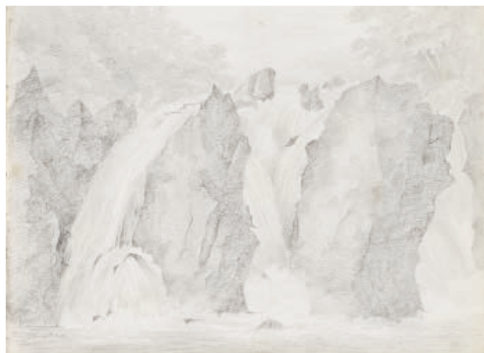
Falls of the Braan

door te brengen. Ze reisden vanuit Londen per koets, waarin je toen dus zo'n veertig uur zat voordat je in Edinburgh aankwam. Zo'n reis was schreeuwend duur, omdat je ook drie nachten in hotels moest doorbrengen. Net voor de eerste spoorlijnen werden geopend, beleefde de postkoets hoogtijdagen. Steeds sneller gingen ze. Ze heetten dan ook Rocket, Comet of Greyhound en de concurrentie was moordend. Bij sommige kreeg je je geld terug als je niet op tijd aankwam. Het fileprobleem bestaat overigens al veel langer dan wij denken: bij Hounslow, destijds aan de rand van Londen, stond een megakoetshuis met 2500 paarden. Mendelssohn raakte diep onder de indruk van het Schotse landschap. Het inspireerde hem uiteindelijk tot het componeren van een paar absolute meesterwerken, zoals de ouverture Die Hebriden en de Derde symfonie, de 'Schotse' . Mendelssohn was daar ook weer druk aan het schetsen.