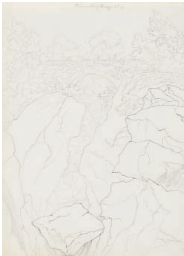
Rumbling Bridge (l: FM/r: KS)